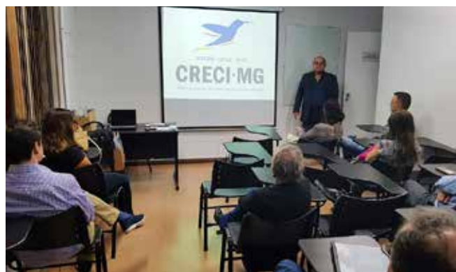
Projeto "O CreCI-MG vai até você" leva informações aos alunos de TTI