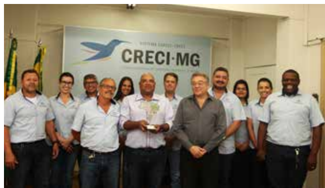
Equipe de Fiscalização comemora resultados

Em 2017, 1.196 pessoas procuraram atendimento no Conselho para tratar de assuntos relacionados com a Fiscalização – tais como: consultas, pedidos de orientação, defesas, recursos, vistas de processos. Desses, 128 denúncias foram formalizadas.