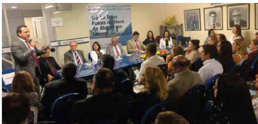
Lançamento da cartilha os 15 erros fatais

Distribuído gratuitamente, o material pode ser retirado na regional do Estado, no horário das 08 às 17h, de segunda a sexta ou através do site: www.creci-pe.gov.br/downloads .