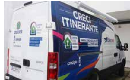
Indo cada vez mais longe

não possuem Delegacias do Conselho, esclarecendo dúvidas acerca de documentação, certidões e contratos necessários a um negócio imobiliário, bem como recebendo denúncias sobre exercício ilegal da profissão e atuação de corretores de imóveis e imobiliárias.