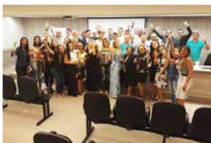
Além do seminário sobre usucapião extra judicial, houve uma solenidade de entrega de carteiras definitivas e posse da diretoria do município do Crato, além de uma audiência com o prefeito da cidade sobre o cálculo da avaliação do ITBI