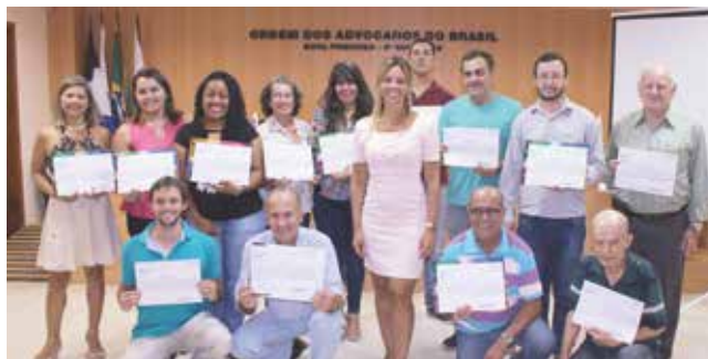
Durante o ano, são diversas iniciativas de aprimoramento profissional, como o curso de Avaliação Imobiliária, realizado em Nova Friburgo

No primeiro trimestre do ano, uma extensa programação de cursos, palestras, e workshops levou para todo o Estado uma abordagem completa sobre os temas essen-