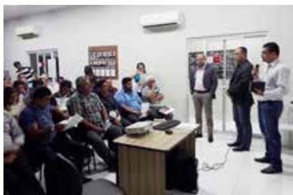
Os dez passos de um corretor campeão de vendas, automotivação profissional e foco imobiliário foram os temas do seminário em Juazeiro do Norte, no dia oito de março.