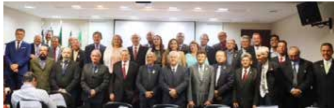
Diretoria do Creci-RN e homenageados com o Troféu Colibri

O Conselho Regional de Corretores de Imóveis do Rio Grande do Norte (Creci-RN) viveu no dia 27 de fevereiro uma data especial: os 39 anos de sua fundação. Para comemorar, foi realizada uma Plenária especial que entregou a maior honraria da instituição o “Troféu Colibri”. O evento reuniu membros da diretoria, conselheiros, colaboradores, familiares e amigos no auditório do Creci.