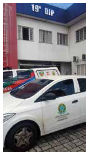
Carro do Creci AM/RR 18ª Região e Policia Militar

É inadmissível ainda estes profissionais defenderem este tipo de atividade ilegal. Os mesmos irão responder pelos seus atos.