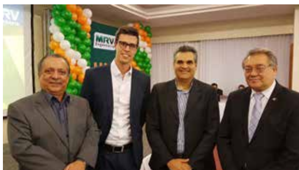
CreCI-MG e MRV se unem para qualificar corretores