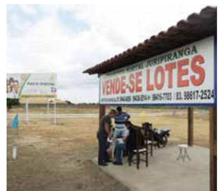
Fiscalização se faz presente em toda a PB