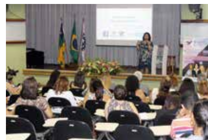
Palestras e um painel imobiliário fizeram parte da programação