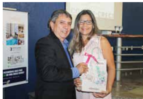
Homenageadas participaram de sorteio de brindes