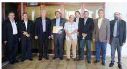
Diretoria entrega pleito a deputado potiguar