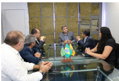
Banco tem interesse em intensificar sua participação no mercado imobiliário.