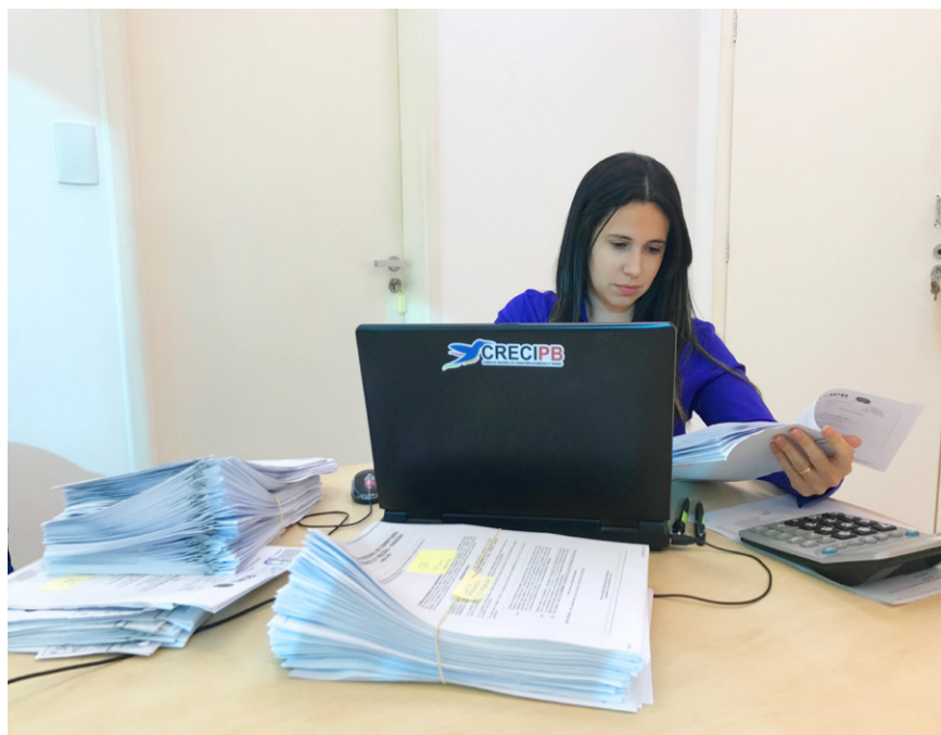
Inadimplência está sendo combatida de diversas formas

Outras medidas adotadas com base na Resolução do Cofeci nº 176/84 são a penhora on line de dinheiro disponível em instituição bancária que baste à satisfação do (s) débitos (s) objeto da Ação de Execução Judicial, inclusão do seu nome na lista de devedores do Conselho, impossibilidade de emissão de Certidão de Regularidade Profissional e inscrição do CPF/MF no Cartório de Protesto de Títulos e Documentos.