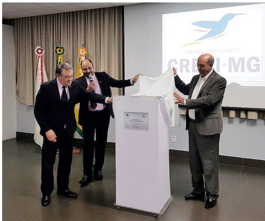
inauguração de Patos de Minas com a presença do prefeito José Eustáquio Rodrigues Alves