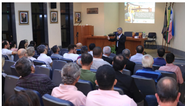
Captação de imóveis