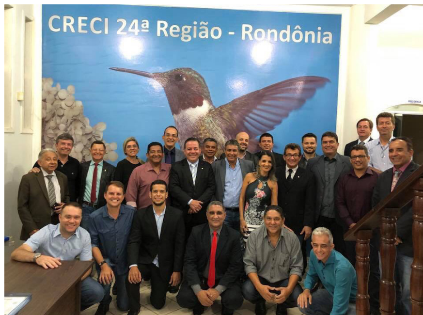
Plenária Especial de Diplomação e Eleição para composição da nova diretoria do CRECI-RO, triênio 2019/2021.