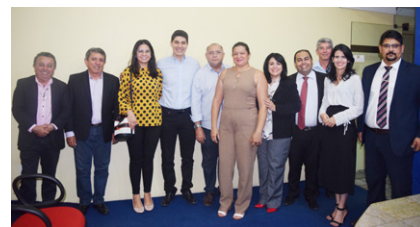
Centro tem previsão de iniciar os trabalhos ainda em 2018

do procuramos diretamente a Justiça se torna mais oneroso e com um tempo de tramitação bem maior. O Centro veio para agregar de forma muito positiva”, disse. Com o investimento nesses novos tipos de práticas de solução de conflitos, o CRECI-PI ficará equipado a outros Estados como São Paulo, Rio de Janeiro, Santa Catarina, Paraíba e Goiás, que já utilizam esse mecanismo de mediação.