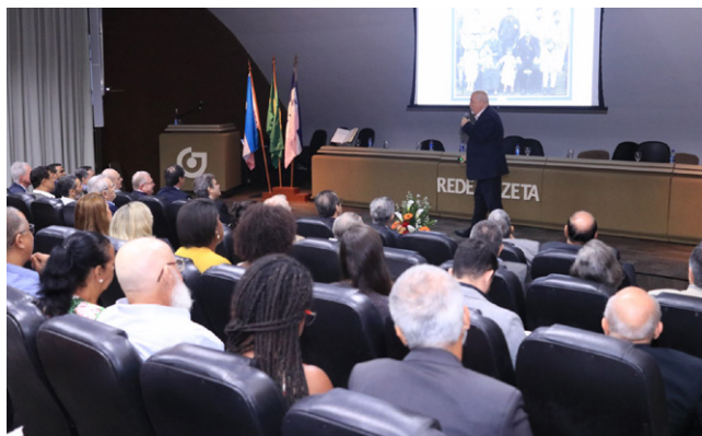
Palestra no mês do Corretor de Imóveis

O CRECI-ES continua cumprindo sua missão, visão e valores em prol da capacitação, valorização e crescimento com respeito da categoria na sociedade.