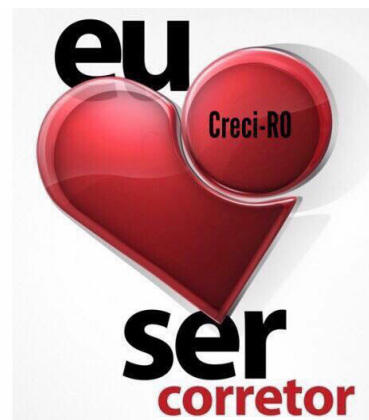
Campanha de valorização da profissão Corretor de Imóveis - CRECI-RO

Em 2019, conte com a gente! Feliz ano novo. CRECI - RO