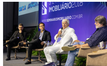
Painel com Caramelo e Palestrantes

O Seminário Imobiliário 2018 foi realizado pelo CRECI/BA e Sistema COFECI/CRECI, com o apoio institucional da Associação de Dirigentes de Empresas do Mercado Imobiliário da Bahia (Ademi), Sindicato da Habitação (Secovi), Sinduscon e Senai Cimatec. O encontro foi patrocinado pela Caixa Econômica Federal.