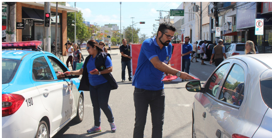
Durante a campanha houve distribuição de material explicativo sobre o projeto.