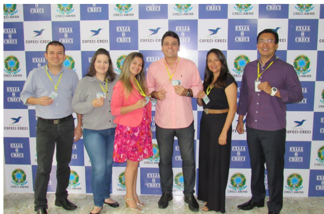
Diretoria Executiva do CRECI AM/RR