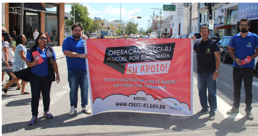
Equipe de fiscais atuou na conscientização da sociedade sobre a importância do corretor de imóveis

Campanhas de conscientização como essa serão levadas para outras cidades e regiões para atingir um número maior de pessoas. Ao se deparar com uma situação de ilegalidade, de verificar que não se trata de um corretor de imóveis que está intermediando a negociação não perca tempo e denuncie à fiscalização do Creci-RJ para que possa tomar as devidas providências. Não alugue um imóvel com quem não é registrado no Creci.