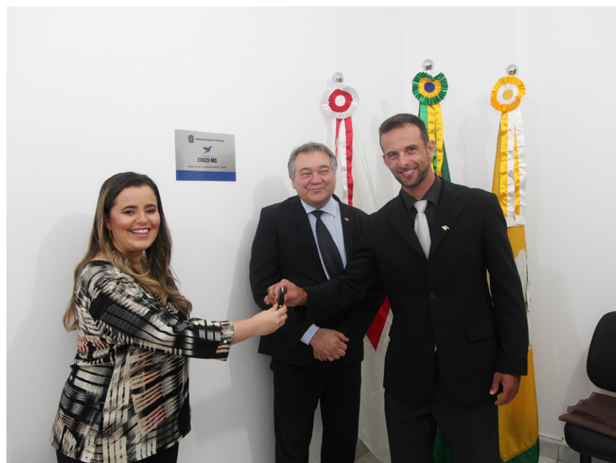
inauguração sete lagoas e entrega da chave do carro da fiscalização