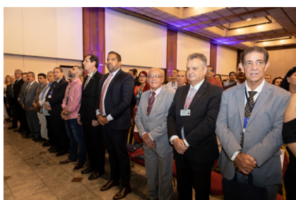
Representantes do COFECI e CRECI's

ções que estão chegando. Os corretores não vão vender só o produto e sim os valores agregados a ele."