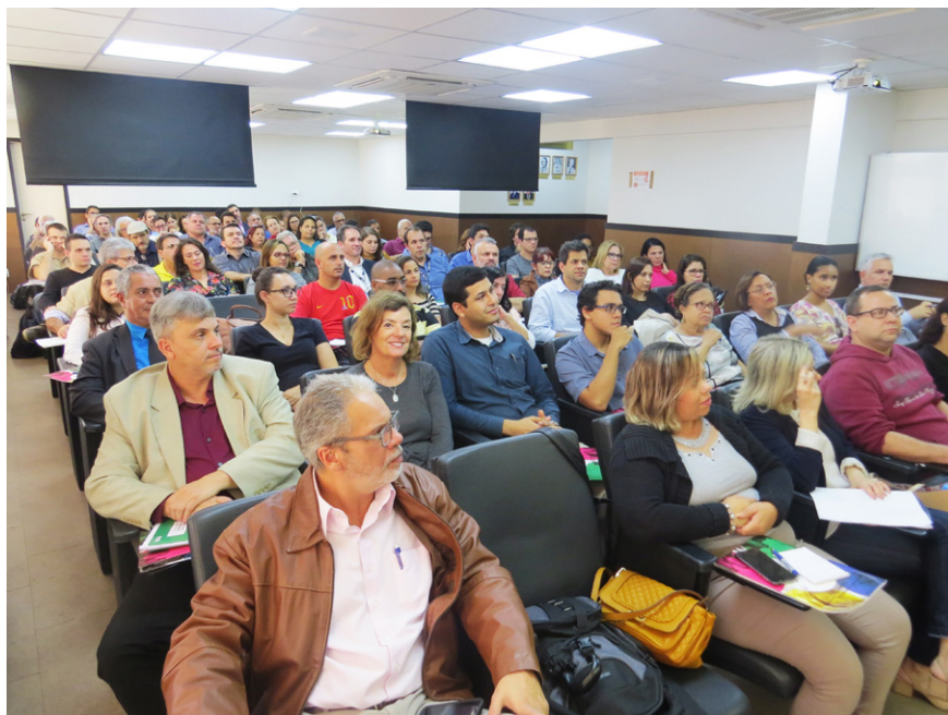
Auditório lotado durante curso na sede do Creci-RJ. De 2016 até nov/2018, mais de 1.650 iniciativas de aprimoramento foram realizadas em todo o estado

Porém o grande destaque entre as realizações da Universidade Corporativa foi a criação da Pós-Graduação em Negócios Jurídicos, Empresariais e Imobiliários, em parceria com a Universidade de Vassouras.